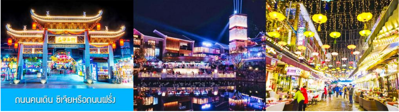
ถนนคนเดิน ซิเจียหรือถนนฝรั่ง