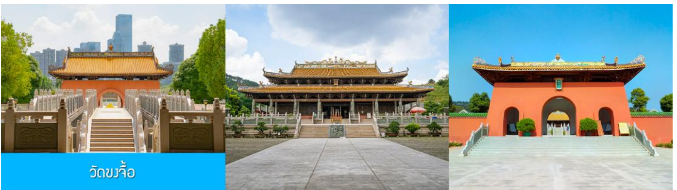
วัดขงจื้อ

เช้า บริการอาหารเช้า ณ ร้านอาหารในโรงแรม (8)