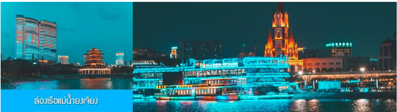
ล่องเรือแม่น้ำยวเจียง

ไกด์ท้องถิ่นนำเสนอ โปรแกรมทัวร์เสริม OPTIONAL TOUR ล่องเรือแม่น้ำยวเจียงชมแสงสียามค่ำของเมืองหนานหนิง..... อัตราค่าบริการสำหรับโปรแกรมเสริมเมืองลับแล ท่านละ 250 หยวน ใช้เวลาประมาณ 1 ชั่วโมงครึ่ง ค่าบริการรวม ค่าบัตรเข้าชม ค่ารถรับ ส่ง และค่าน้ำเที่ยวของไกด์ท้องถิ่น