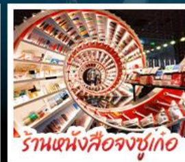
ร้านหนังสือจุงซูเกอ