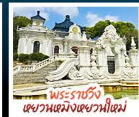
พระราชวัง เขยวนเหมิงเขยวนหนี่เหม