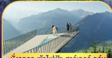
นั่งรถกระเช้าไฟฟ้า ฮาร์เตอร์ คูล์ม