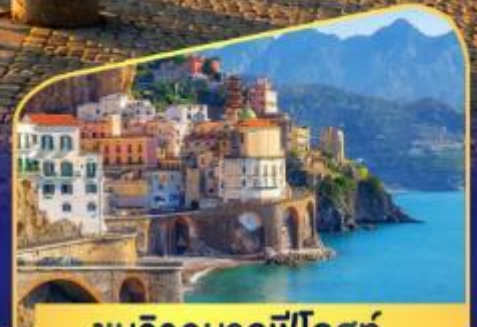
ชมวิวมอลฟีโคสก์