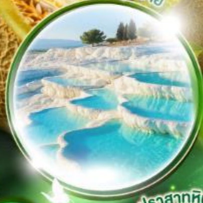
ปราสาทหินยิวซาร์