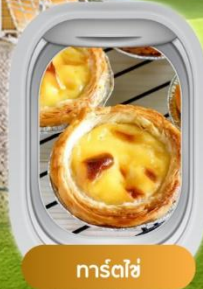
ทาร์ตไข่