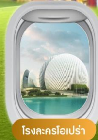
โรงละครโอเปร่า