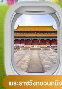
พระราชวังหยวนหมิง