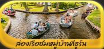
ล่องเรือชมหมู่บ้านกังหัน