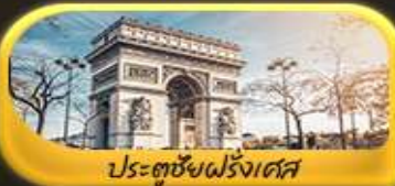
ประตูชัยฝรั่งเศส

พิเศษ!! ล่องเรือแม่น้ำแซนชมเมือง โดย บาโด มุช