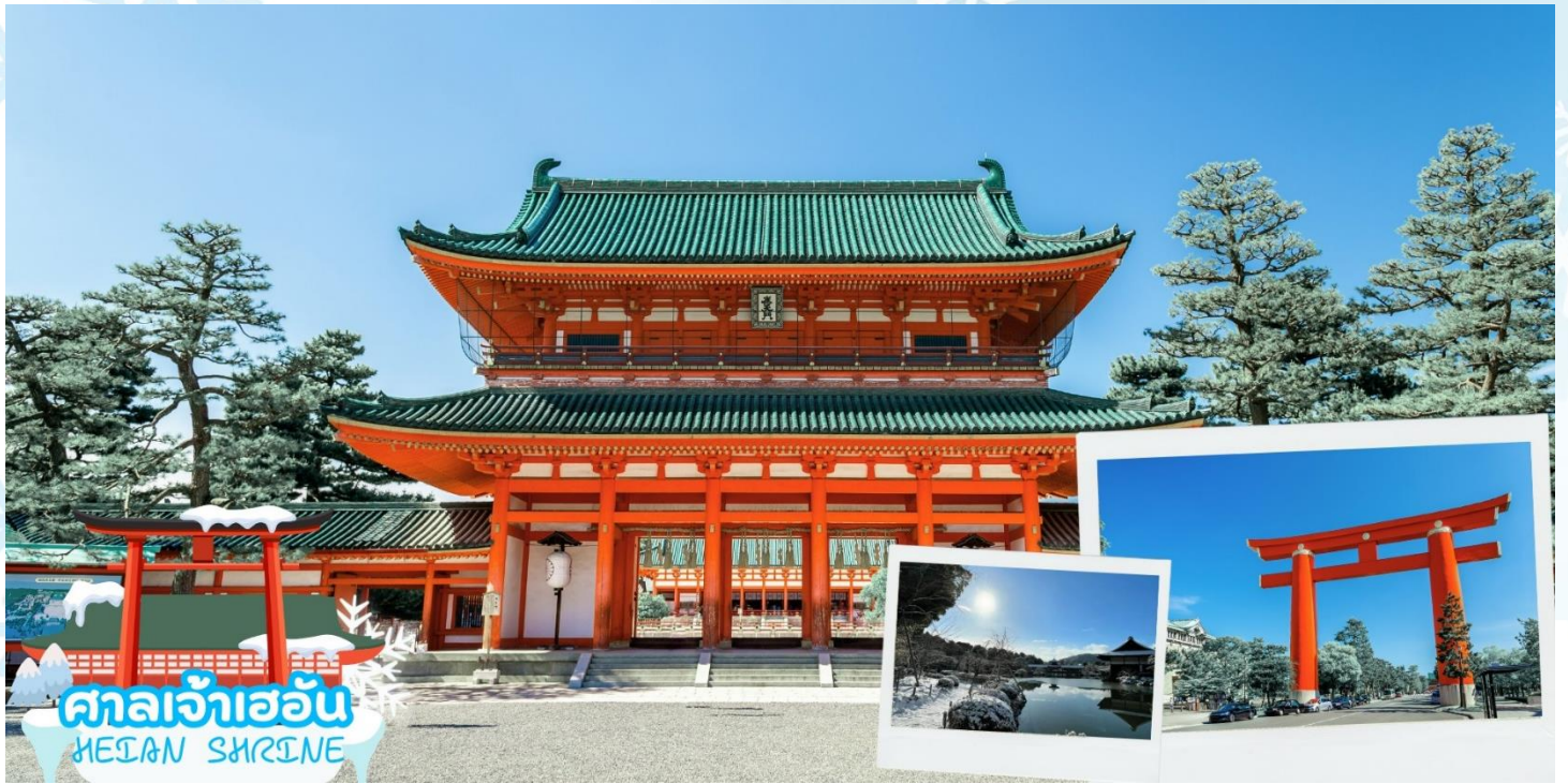
ศาลเจ้าเฮอัน HEIAN SHRINE

ศาลเจ้าเฮอัน (Heian Shrine) สร้างขึ้นเพื่อเป็นอนุสรณ์ฉลองอำนาจปกครองของเมืองเกียวโตที่ครบรอบ 1,100 ปีในฐานะเมืองหลวงของประเทศญี่ปุ่น โดยมีประตูโทริอิสีแดงตระหง่านเป็นองค์ประกอบที่สะดุดตาที่สุด ศาลเจ้าแห่งนี้เป็นสัญลักษณ์อันโดดเด่นและสถานที่ท่องเที่ยวสำคัญของเกียวโต บริเวณด้านหลังของศาลเจ้านี้ มีสวนเฮอัน ครอบคลุมพื้นที่ประมาณ 33,000 ตารางเมตร สามารถเดินเล่นสัมผัสความร่มรื่นได้อย่างสงบผ่อนคลาย บรรยากาศธรรมชาติของที่นี่เรียกได้ว่าสวยงามทุกฤดูกาล