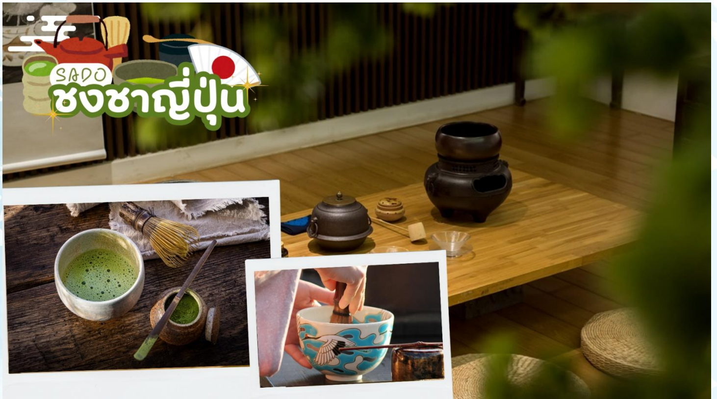
SADO ชงชาญี่ปุ่น

ศาลเจ้าเฮอัน (Heian Shrine) สร้างขึ้นเพื่อเป็นอนุสรณ์ฉลองอำนาจปกครองของเมืองเกียวโตที่ครบรอบ 1,100 ปีในฐานะเมืองหลวงของประเทศญี่ปุ่น โดยมีประตูโทริอิสีแดงตระหง่านเป็นองค์ประกอบที่สะดุดตาที่สุด ศาลเจ้าแห่งนี้เป็นสัญลักษณ์อันโดดเด่นและสถานที่ท่องเที่ยวสำคัญของเกียวโต บริเวณด้านหลังของศาลเจ้านี้ มีสวนเฮอัน ครอบคลุมพื้นที่ประมาณ 33,000 ตารางเมตร สามารถเดินเล่นสัมผัสความร่มรื่นได้อย่างสงบผ่อนคลาย บรรยากาศธรรมชาติของที่นี่เรียกได้ว่าสวยงามทุกฤดูกาล