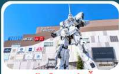
ห้างโตเวอร์ซิตี