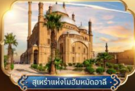
สุเหร่าแห่งโมฮัมหมัดอาลี