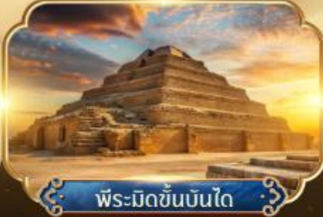
พีระมิดขั้นบันได

เริ่มต้น 48,800.- ★ ขี้อูฐชมมหาสฟิงซ์และ พีระมิดแห่งกิซ่า ★ ชมพิพิธภัณฑ์แกรนด์อียิปต์ GEM