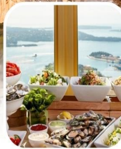
SKYFEAST BUFFET SYDNEY TOWER