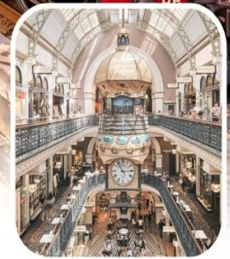
QUEEN VICTORIA BUILDING