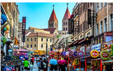
ถนนจงซาน