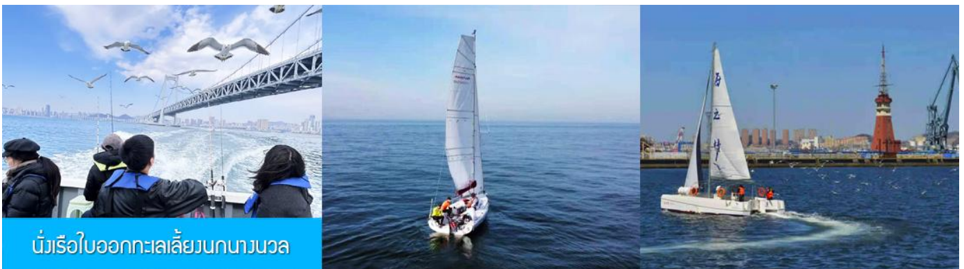
นั่งเรือใบออกทะเลลิ้นบกนางนวล