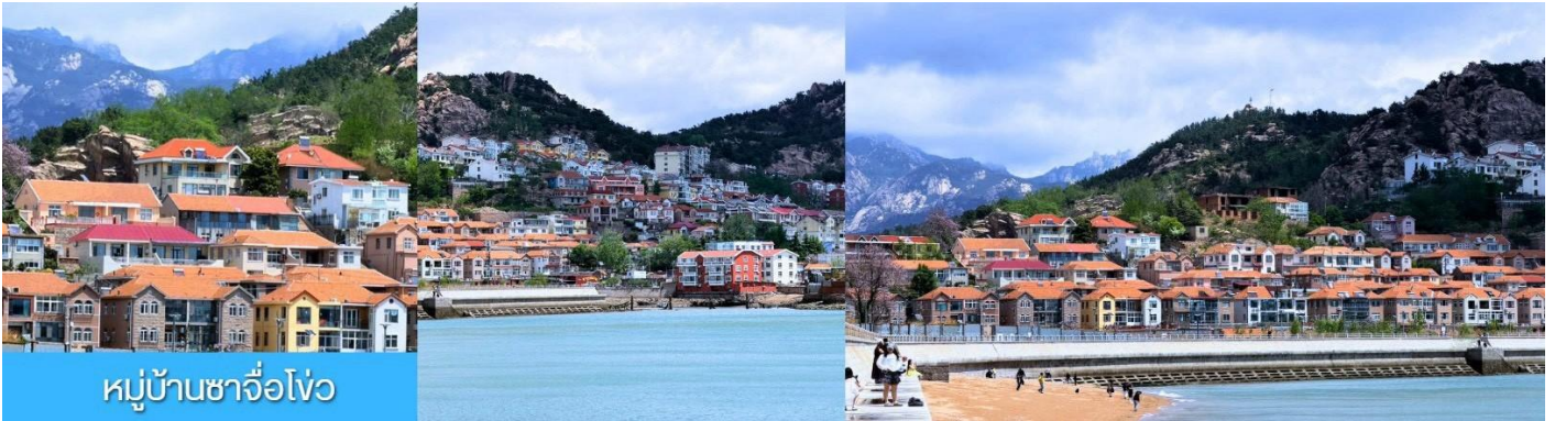
หมู่บ้านชาวโอ้ว

เที่ยง รับประทานอาหารกลางวัน ณ ภัตตาคาร เมนูซีฟู้ด (11)