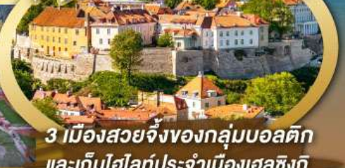
3 เมืองสวยจังของกลุ่มบอลติก และเก็บไฮไลท์ประจำเมืองเฮลซิงกิ และล่องเรือเฟอร์รี่ข้ามประเทศ

ไฮไลท์ในโปรแกรม • เที่ยวสามประเทศหลักกลุ่มบอลติก • ชมเมืองหลวงวิลนิอุส ประเทศลิทเวีย