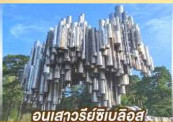
อนุสาวรีย์ซีเบลึส