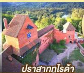
ปราสาทกูไรต้า