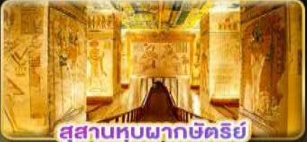
สุสานหุบผากษัตริย์