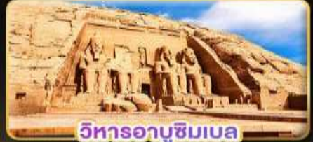
วิหารอาบูซิมเบล

น้ำหนักกระเป๋า 23Kg. (ใบระหว่างประเทศ และบินภายใน)