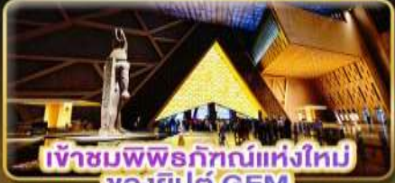
เข้าชมพิพิธภัณฑ์แห่งใหม่ ของอียิปต์ GEM