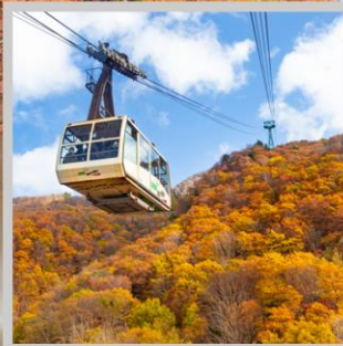
“ZAO CHUO ROPEWAY”