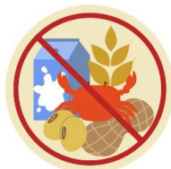
● แพ้อาหาร / อื่นๆโปรดระบุ