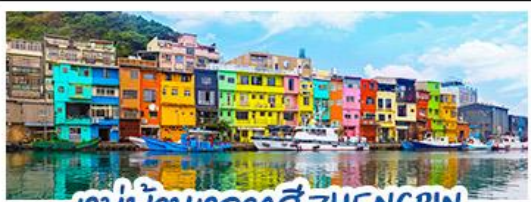
หมู่บ้านหลากสี ZHENGBIN

18 - 21 ก.ค. 69 | 12 - 15 ก.ย. 69 15 - 18 ส.ค. 69 | 28 - 31 ต.ค. 69