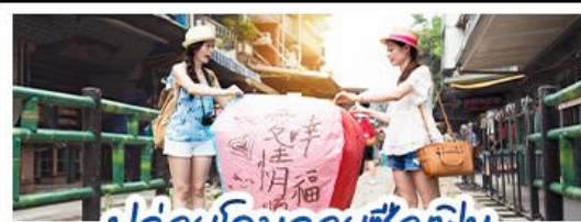
ปลออยโคมลอยซือเฟิน