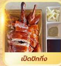
เปิดปีกทั้ง