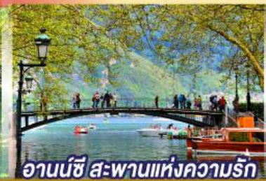
อานน์ซี สะพานแห่งความรัก