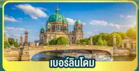
เบอร์ลินโดม