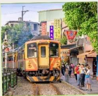
สถานีรถไฟสี่อเฟิ่น