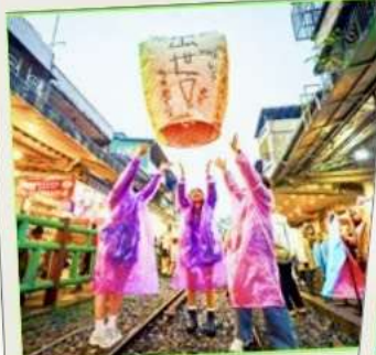
ปล่อยโคมลอย