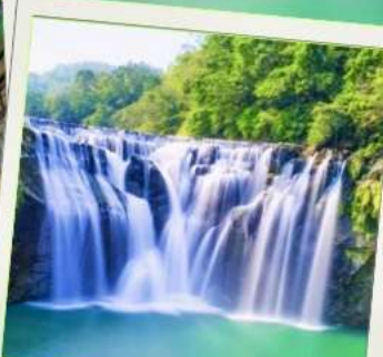
น้ำตกสี่อเฟิ่น