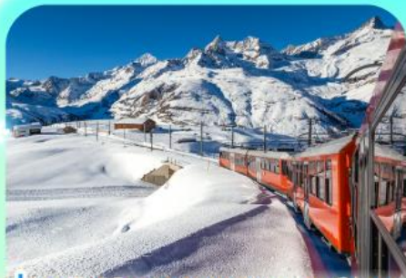
นั่งรถไฟสู่ยอดเขารอนเนอร์เกรด