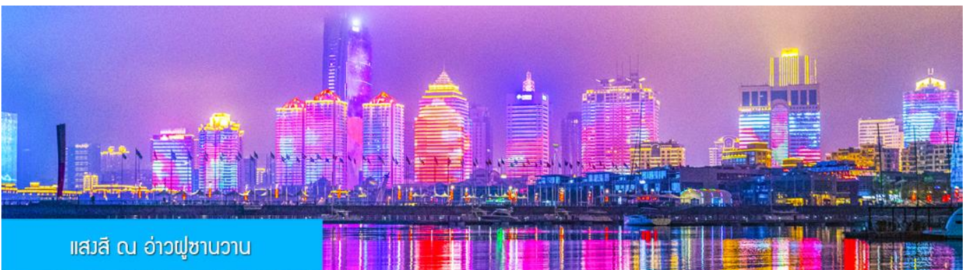
แอสสิ ณ อ่าวฟูซานวาว

ค่ำ รับประทานอาหารค่ำ ณ ภัตตาคาร *เมนูซีฟู้ด (3)