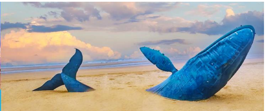
ประติมากรรม วาฬโดดเดี่ยว

นำท่านถ่ายภาพสุดสร้างสรรค์ที่ประติมากรรม วาฬเกยตื้น หรือวาฬโดดเดี่ยว 孤独的鲸 วาฬยักษ์ตัวนี้กำลังกระโดดขึ้นจากทะเล ซ่อนตัวอยู่ท่ามกลางทะเลป้อให้สับสนใคร่ครวญ เป็นจุดถ่ายภาพยอดนิยมในช่วงน้ำลง ให้ท่านได้เก็บภาพ จุดไฮไลต์ที่เป็นที่ระลึก