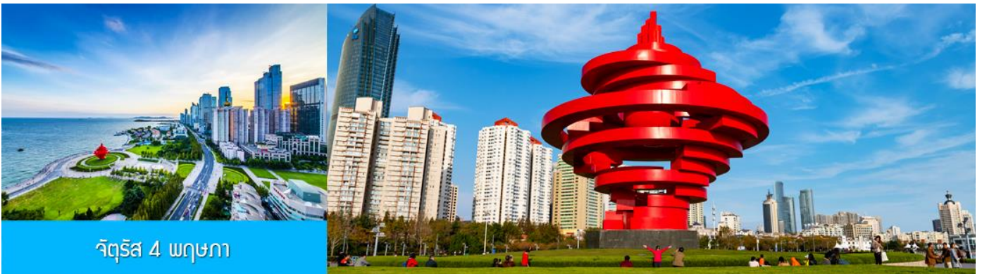
จัตุรัส 4 พฤษภาคม

จากนั้นนำท่านเที่ยวชม โรงเบียร์ชิงเต่า 青岛啤酒博物馆 พิพิธภัณฑ์เบียร์ที่ขึ้นชื่อของเมืองชิงเต่า ซึ่งเป็นเบียร์ยี่ห้อแรกที่ผลิตขึ้นในประเทศจีน ชมเบียร์ คอลเลกชั่นที่มียี่ห้อหลากหลายที่สุดของโลก และชมการจัดแสดงภาพและวิดิทัศน์เกี่ยวกับวิวัฒนาการของเบียร์ ขั้นตอนการผลิตและอื่น ๆ ที่เกี่ยวข้อง พร้อมชิมเบียร์ชิงเต่า ซึ่งเป็นเบียร์ที่ขายดีที่สุดในยี่ห้อหนึ่งของจีน.. (ชิมเบียร์ชิงเต่าท่านละ 1 แก้ว รับกลับอีก 1 ขวดเล็ก ตอนเดินออก)