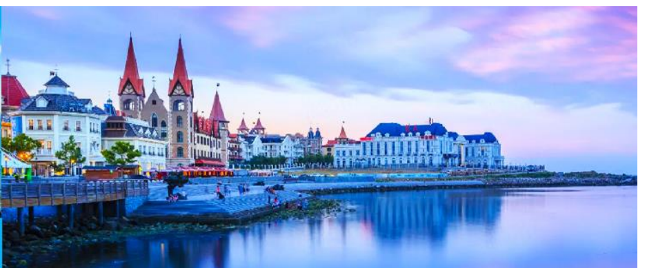
ท่าเรือชาวประมงไห่ซาง