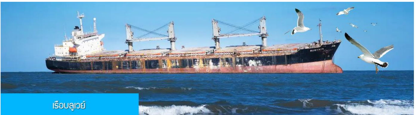
เรือบลูเวย์

เที่ยง รับประทานอาหารกลางวัน ณ ภัตตาคาร (5)