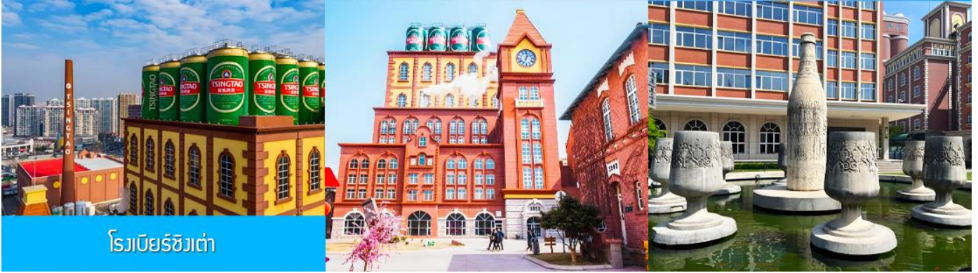
โรงเบียร์ชิงเต่า

จากนั้นนำท่านเที่ยวชม โรงเบียร์ชิงเต่า 青岛啤酒博物馆 พิพิธภัณฑ์เบียร์ที่ขึ้นชื่อของเมืองชิงเต่า ซึ่งเป็นเบียร์ยี่ห้อแรกที่ผลิตขึ้นในประเทศจีน ชมเบียร์ คอลเลกชั่นที่มียี่ห้อหลากหลายที่สุดของโลก และชมการจัดแสดงภาพและวิดิทัศน์เกี่ยวกับวิวัฒนาการของเบียร์ ขั้นตอนการผลิตและอื่น ๆ ที่เกี่ยวข้อง พร้อมชิมเบียร์ชิงเต่า ซึ่งเป็นเบียร์ที่ขายดีที่สุดในยี่ห้อหนึ่งของจีน.. (ชิมเบียร์ชิงเต่าท่านละ 1 แก้ว รับกลับอีก 1 ขวดเล็ก ตอนเดินออก)