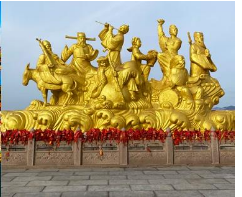
อุทยานท่งเที่ยวแปดเซียนข้ามทะเล