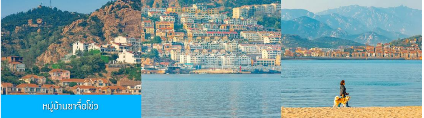
หมู่บ้านซาจื่อโข่ว

เช้า รับประทานอาหารเช้า ณ ห้องอาหารของโรงแรม (4)