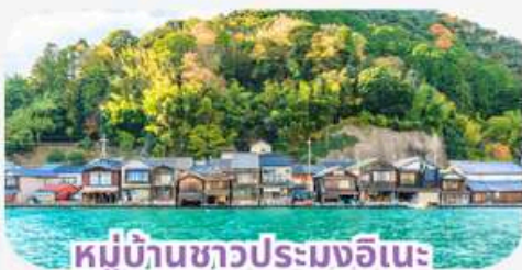
หมู่บ้านชาวประมงอินะ