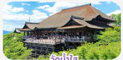
วัดน้ำใส