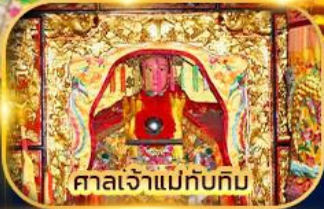
ศาลเจ้าแม่ทับทิม