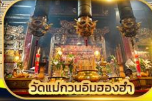
วัดแม่กวนอิมฮ่องฮ่า