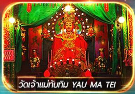
วัดเจ้าแม่ทับทิม YAU MA TEI