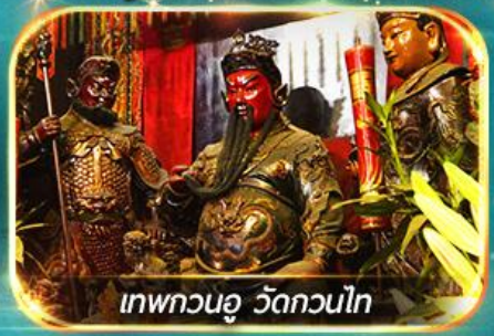
เทพกวนอู วัดกวนไท

พามุไหว้พระขอพร 8 วัดดัง, อิสระช้อปปิ้ง 1 วันเต็มแบบจุใจ หรือเลือกซื้อ OPTION กระเป๋าหนัง 360 / ดิสนีย์แลนด์