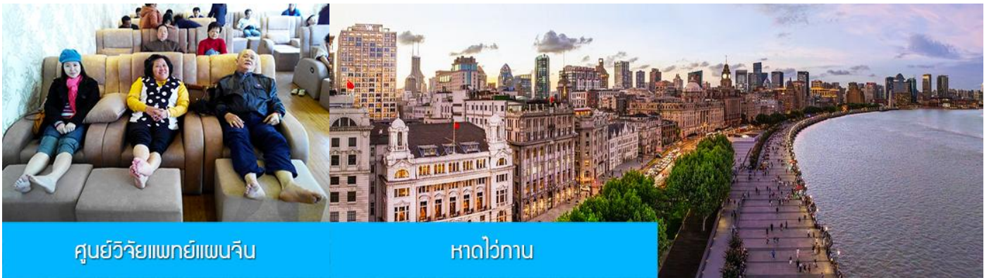
ศูนย์วิจัยแพทยแผนจีน