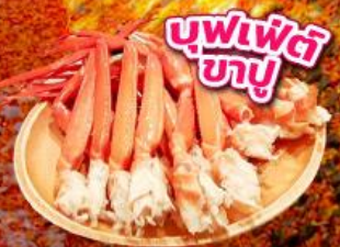
บุฟเฟ่ต์ ซาซู

ชมใบไม้เปลี่ยนสี อุโมงค์ใบเมเปิ้ล โมมิจิโคโร