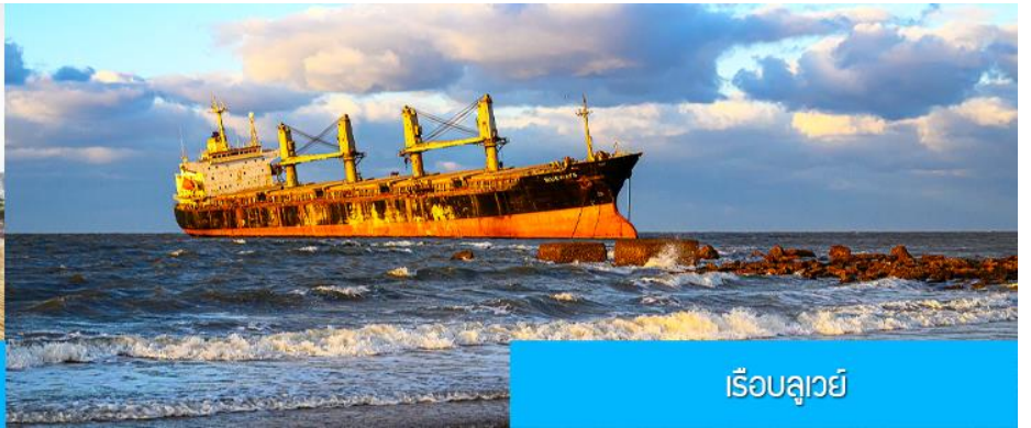
เรือบลูเวย์