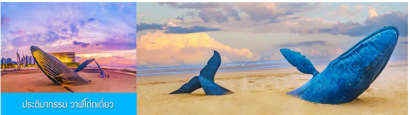
ประติมากรรม วาฬโดดเดี่ยว

นำท่านชมซุ้มประตูฝิงไหล พระราชวังมังกร พระราชวังราชินีแห่งสวรรค์ และศาลาหลัก ชมทัศนียภาพอันตระการตาของเขตแดนทะเลเหลือง-ทะเลป้อไห่ ชม " ศาลาอมตะทะยานสู่ท้องฟ้า " จากนั้นนำท่านเดินทางไป ยังจุดชมวิวแปดเซียนข้ามทะเล ชมสถานที่สำคัญอันเป็นสัญลักษณ์ เช่น หอคอยเซียนหยวน กำแพงแปดเซียน และศาลาฮู่เซียน โครงสร้างรูปทรงน้ำเต้าที่ล้อมรอบด้วยทะเลทั้งสามด้าน เชื่อมโยงตำนานแปดเซียนเข้ากับ ความมหัศจรรย์ของภาพลวงตา