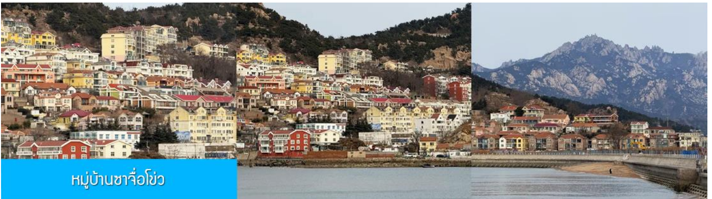
หมู่บ้านซาจื่อโข่ว

เที่ยง รับประทานอาหารกลางวัน ณ ภัตตาคาร (มื้อที่ 7)