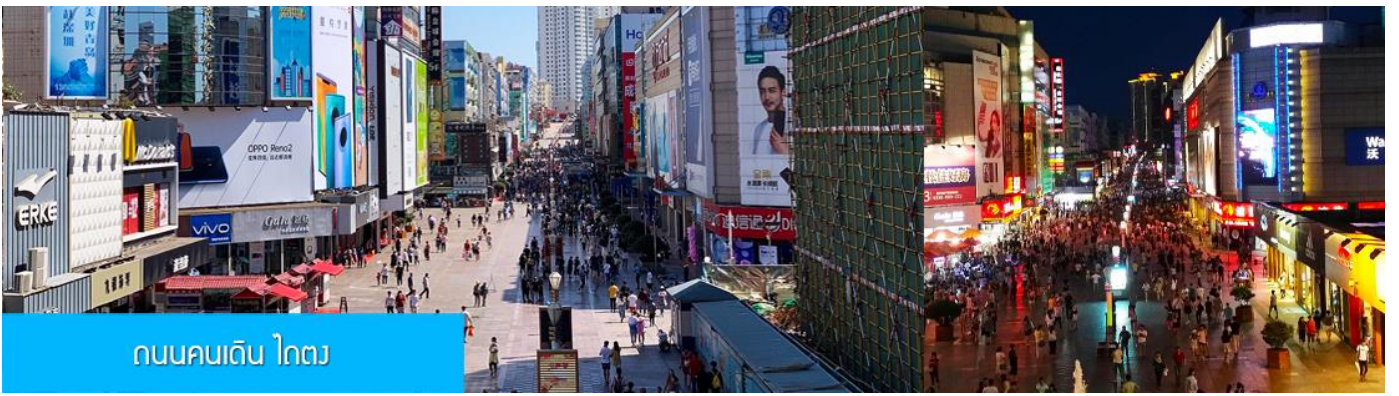
ถนนคนเดิน ไตตง

จากนั้นนำท่าน สู่ ถนนคนเดิน ไตตง 台东步行街 ย่านการค้าเป็นถนนคนเดินที่ใหญ่และคึกคักของเมืองชิงเต่า ที่นี่เป็นแหล่งรวมร้านค้าสินค้าแฟชั่นร่วมสมัย สินค้าพื้นเมือง ของที่ระลึก และร้านอาหาร บาร์เบียร์ของเมืองชิงเต่ามากมาย, ให้ท่านมีเวลาอิสระเดินเล่น ช้อปปิ้ง ลิ้มรสอาหารพื้นเมือง และเลือกซื้อของฝาก ตามอัธยาศัย