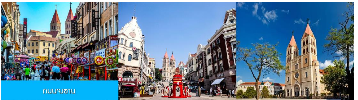
ถนนนางซาบ

หลังอาหารนำท่านเดินทางชม สะพานจ้านเจียว เป็นแลนด์มาร์กประวัติศาสตร์คู่เมืองชิงเต่า สร้างเมื่อปี ค.ศ. 1891 มีลักษณะเป็นสะพานหินทอดยาวกว่า 440 เมตรสู่ทะเล ปลายสะพานมีศาลา ทรงแปดเหลี่ยมสีแดงที่โดดเด่น ซึ่งเป็นสัญลักษณ์บนฉลากเบียร์ชิงเต่า ขึ้นชื่อเรื่องวิวสวย รับลมทะเล ให้ท่านเก็บภาพบรรยากาศ จากนั้นนำท่านเดินเที่ยวชม ถนนจงซาน 中山路 ถนนที่เต็มไปด้วยกลิ่นอายยุโรป และถนนสายนี้มีบันทึกเรื่องราวมากกว่าศตวรรษของเมืองชิงเต่าไว้ ที่นี่เป็นศูนย์กลางการค้าแห่งแรกที่เต็มไปด้วยสถาปัตยกรรมสไตล์ยุโรปเก่าแก่ที่ได้รับอิทธิพลมาจากเยอรมัน ให้ท่านได้เดินเก็บบรรยากาศ และ เก็บภาพกับ โบสถ์เซนต์ไมเคิล (ด้านนอก) โบสถ์แห่งนี้ที่คู่รักนิยมมาถ่ายภาพงานแต่งงานกันมากที่สุดในเมืองชิงเต่า ให้ท่านถ่ายรูปเก็บภาพ จากนั้นเดินทางต่อ สู่ย่าน เมืองเก่าเยอรมัน ตรอกกว้างชิงหลี่ 广兴里 ตรอกชอกชอยที่เรียงรายไปด้วยอาคารสถาปัตยกรรมแบบ ผสมผสานจีนและอาคารสไตล์ยุโรป