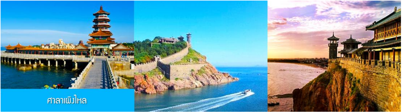
ศาลาเพิงไหล

หรูหรา และได้สัมผัสกับสถาปัตยกรรมสไตล์บารอกที่ยิ่งใหญ่ เหมือน หลุดเข้าไปในเทพนิยายของยุโรป ให้ท่านเก็บภาพบรรยากาศตามอรัยาศัย จนได้เวลาอันสมควร นำท่านเดินทางสู่ภัตตาคาร