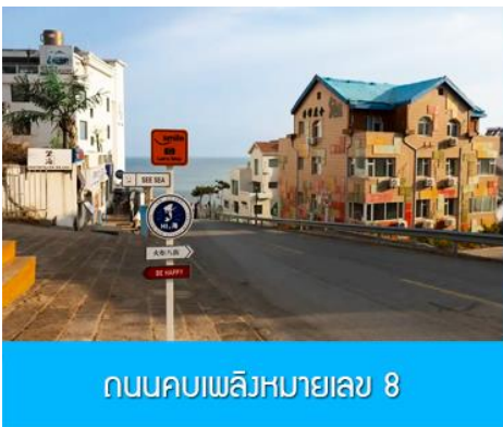
ถนนคอบเพลิงหมายเลข 8

นำท่านจิบไวน์ในปราสาทสไตล์ยุโรป หลีกหนีความวุ่นวายและก้าวเข้าสู่ดินแดนที่ราวกับหลุดมาจากเทพนิยายยุโรป ณ ไร่ไวน์ ชาโตว์ ณ คฤหาสน์ งามอยู่ ปราสาทไวน์อันโอ่อ่าที่ตั้งตระหง่านกลางไร่องุ่นสุดลูกหูลูกตาในเมืองเยียนไถ มณฑลซานตง ที่นี่คือการบรรจบกันอย่างลงตัวของมรดกการผลิตไวน์กว่าร้อยปีของจีนและความเชี่ยวชาญจากฝรั่งเศส ทำให้เกิดเป็นแหล่งท่องเที่ยวที่ไม่เพียงสวยงามน่าถ่ายรูป แต่ยังเป็นสวรรค์ของคนรักไวน์ นำท่านเดินชมสถาปัตยกรรมคลาสสิก เยี่ยมชมห้องเก็บไวน์ใต้ดินอันลึกลับ และปิดท้ายด้วยการชิมไวน์รสเลิศที่ผลิตจากองุ่นในไร่แห่งนี้ เสริมแต่งประสบการณ์ที่จะทำให้การเดินทางของคุณพิเศษยิ่งขึ้น ปิดท้ายประสบการณ์อันสุดแสนคลาสสิกนี้... ด้วยการ ลิ้มรสไวน์แดง (ท่านละ 1 แก้ว) ที่มีชื่อเสียงของที่นี่, จากนั้น นำท่านเดินทางสู่ เมืองเวย์ไห้ 威海 ตั้งอยู่ปลายสุดของคาบสมุทรซานตง ซึ่งเป็นเมืองท่าสำคัญที่มีชายฝั่งทะเลสวยงามสะอาด อากาศเย็นสบายในฤดูร้อนและมีหิมะตกหนักในฤดูหนาว ได้รับอิทธิพลวัฒนธรรมเกาหลีใต้เนื่องจากที่ตั้งใกล้ที่สุด จุดเด่นคือเกาะหลิวกง เมืองหัวเซี่ยเฉิง และบรรยากาศเมืองท่าที่พักผ่อนสบาย นำท่านเก็บบรรยากาศกับ กรอบรูปวิวทะเล อีกหนึ่งไฮไลท์สุดฮิตที่มาเวย์ไห้ ต้องถ่ายรูปกับจุดนี้