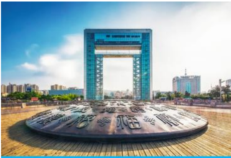
ประตูแห่งโซค

ครบรอบ 100 ปี ของการเปิดท่าเรือเว่ยไห่ จึงขนานนามว่าเป็น ประตูแห่งโซคลาก ที่คอยต้อนรับนักท่องเที่ยวทุกท่าน โครงสร้างของประตูที่ตั้งตระหง่าน โอบล้อมของท้องทะเลและเกาะหลิวกง อยู่เบื้องหน้า เป็นภาพที่สวยงาม ให้ท่านเก็บบรรยากาศเป็นที่ระลึก จากนั้นเดินทางสู่ภัตตาคาร