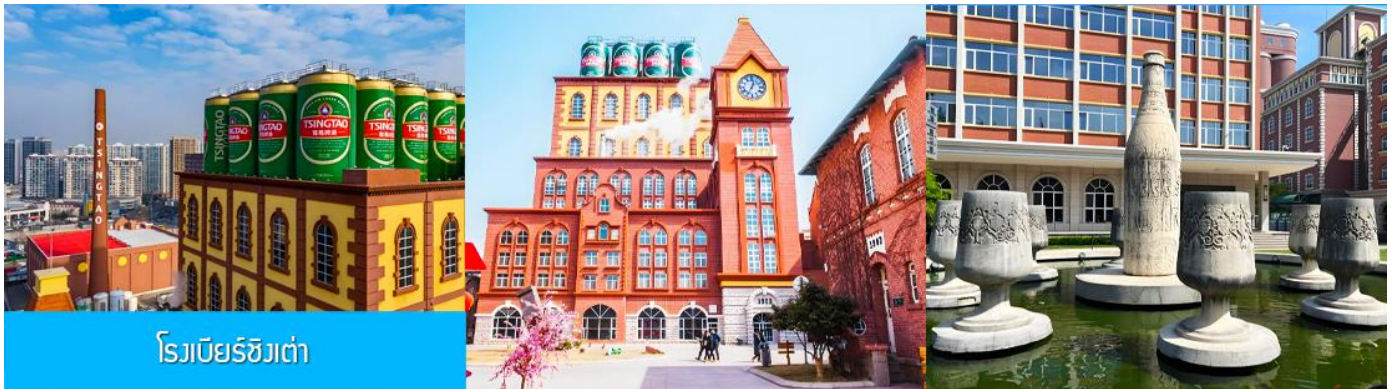
โรงเบียร์ชิงเต่า

จากนั้นนำท่านเที่ยวชม โรงเบียร์ชิงเต่า 青岛啤酒博物馆 พิพิธภัณฑ์เบียร์ที่ขึ้นชื่อของเมืองชิงเต่า ซึ่งเป็นเบียร์ยี่ห้อแรกที่ผลิตขึ้นในประเทศจีน ชมเบียร์ คอลเลกชันที่มียี่ห้อหลากหลายที่สุดของโลก และชมการจัดแสดงภาพและวิทัศน์เกี่ยวกับวิวัฒนาการของเบียร์ ขั้นตอนการผลิตและอื่น ๆ ที่เกี่ยวข้อง พร้อมชมเบียร์ชิงเต่า ซึ่งเป็นเบียร์ที่ขายดีที่สุดยี่ห้อหนึ่งของจีน.. ( ชิมเบียร์ชิงเต่าท่านละ 1 แก้ว รับกลับอีก 1 ขวดเล็ก ตอนเดินออก )