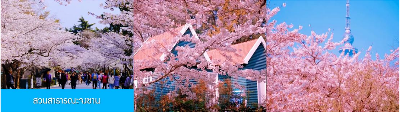
สวนสาธารณะจางซา

ยุโรปในแผ่นดินจีน และเมืองที่มีวัฒนธรรมที่ผสมผสานทิวทัศน์ชายทะเลที่สวยงาม มีมนต์เสน่ห์อันเป็นเอกลักษณ์เฉพาะตัว (ใช้เวลาเดินทางประมาณ 3 ชั่วโมง)