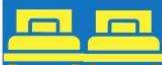
ห้องพักเตียงคู่ TWIN