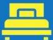
ห้องพักเดี่ยว SINGLE

ตัวอย่างประเภทห้องพัก *เป็นเพียงตัวอย่างเพื่อให้เห็นภาพสำหรับประเภทห้องในแบบต่างๆ