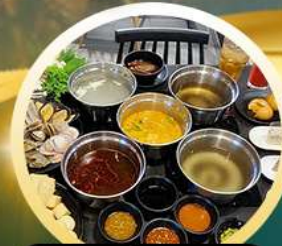
ชาบูฮ่องกง