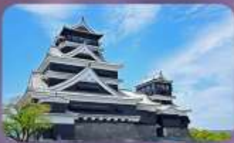
ปราสาทคุมาโมโตะ