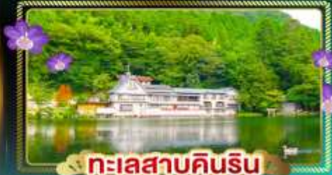
ทะเลสาบคินริน