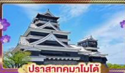
ปราสาทคุมาโมโตะ