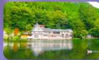
ทะเลสาบคินริน