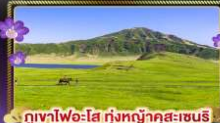
ภูเขาไฟอะโฮะ ทุ่งหญ้าคุสะเซนริ