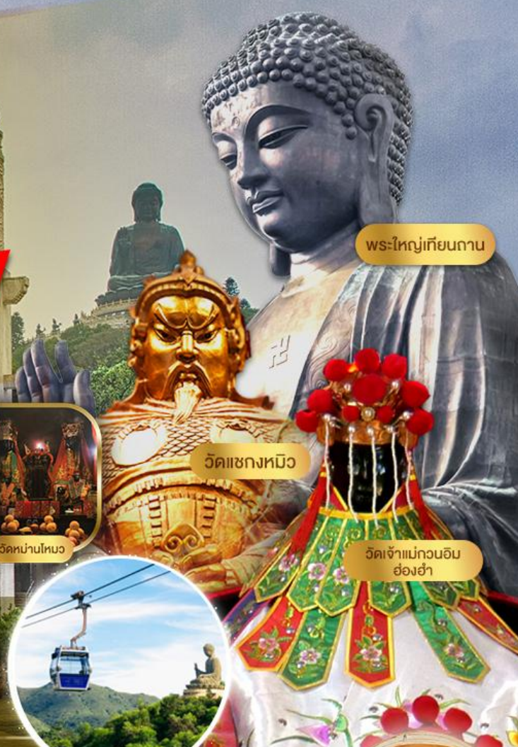
พระใหญ่เทียนถาน