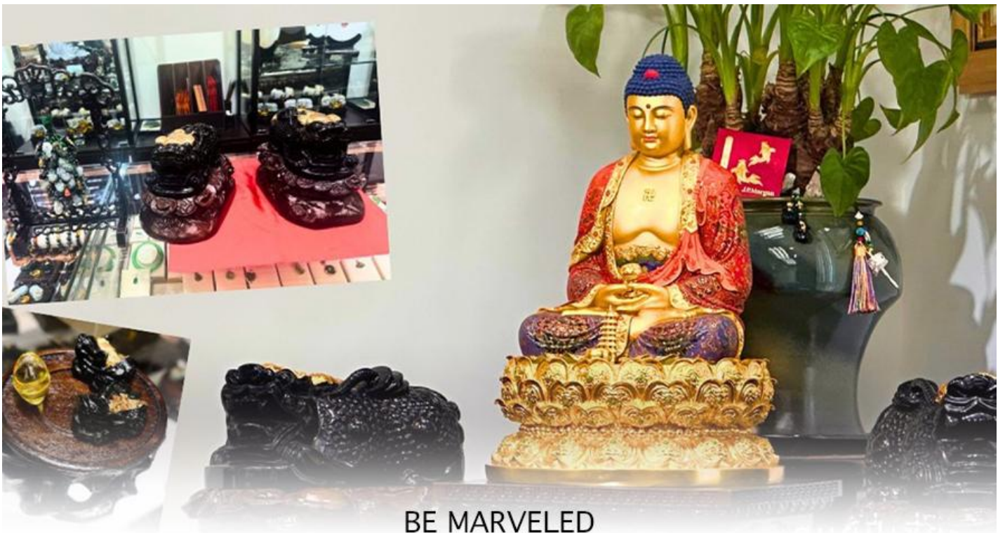
BE MARVELED ศูนย์ปีเซี่ยะ

และนำท่าน ชม ศูนย์ปีเซี่ยะ ซึ่งคนจีนนั้น ถือว่าหยกเป็นหิน ที่เป็นตัวแทนของความสวยงามและความบริสุทธิ์มีความเชื่อว่า หยก มงคล ถ้าพกติดตัวไว้จะอายุยืนและสุขภาพดีมีสินค้ำมากมายเกี่ยวกับหยก อาทิ กำไลหยก หรือสัตว์นำโชคอย่างปีเซี่ยะ ให้ ท่าน ได้เลือกซื้อเป็นของฝาก, ของที่ระลึก หรือของนำโชคแต่ตัวท่านเอง