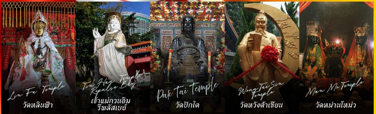
Lin Fa Temple วัดหลินฟ้า

รายการทัวร์ข้างต้นอาจมีการปรับเปลี่ยนเพื่อความเหมาะสม