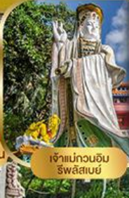
เจ้าแม่กวนอิม ริวสิสเช่