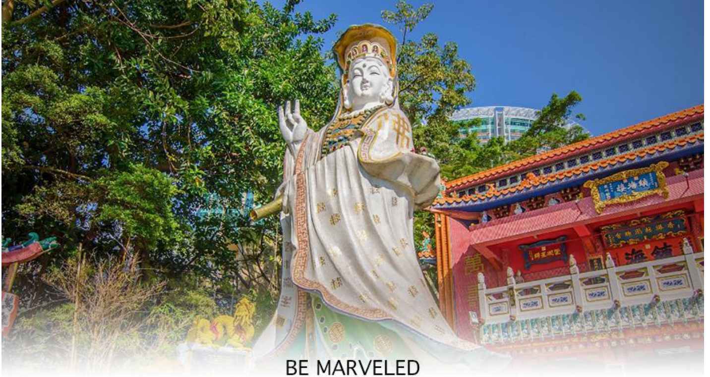
BE MARVELED วัดเจ้าแม่กวนอิมรีพัลส์เบย์

นักท่องเที่ยวนิยมนมาสักการะที่ วัดทินหัว อ่าวรีพัลส์เบย์ (TIN HAU TEMPLE REPULSE BAY) ซึ่งตั้งอยู่ริมทะเล เป็นสถานที่ท่องเที่ยวสำคัญ สร้างขึ้นในปี ค.ศ.1993 มีรูปปั้นของ เจ้าแม่กวนอิม ปางประทานพรตั้งอยู่ ซึ่งคนฮ่องกงและคนจีนให้ความเคารพนับถือมากที่สุด เชื่อว่าเป็นเทพที่มีความศักดิ์มากขอพรเรื่องงานการเงิน และขอพรขอโชคลาภเพื่อเป็นสิริมงคล และขอพร