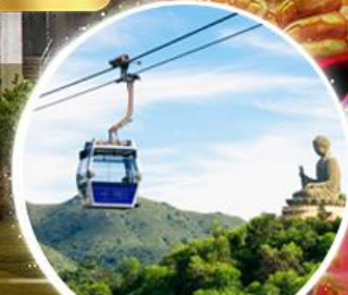
กระเช้าองปิง 360