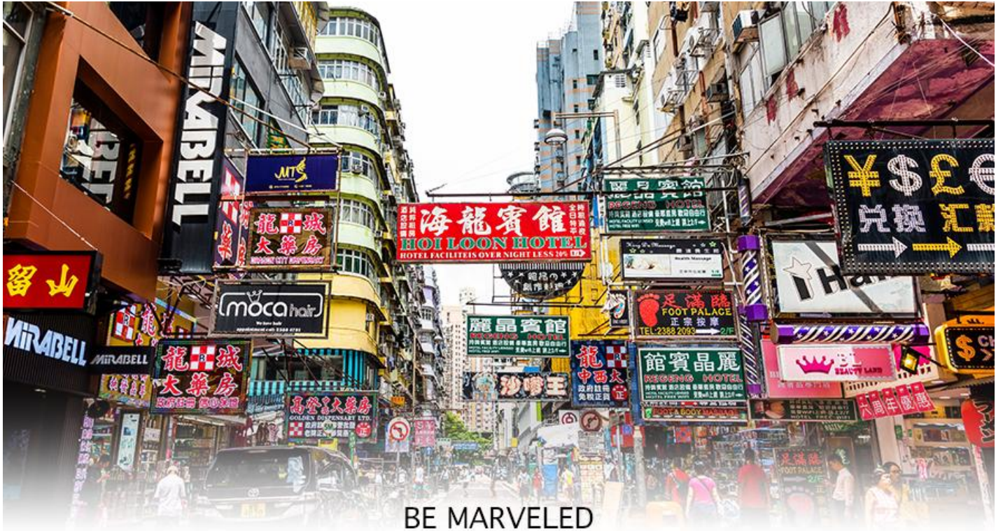
BE MARVELED MONGKOK

หลังจากนั้นนำทุกท่าน ช้อปปิ้ง ย่านมงก๊ก (Shopping Mongkok) เป็นแหล่งช้อปปิ้งที่เต็มไปด้วยตรอกซอกซอยที่มีเอกลักษณ์แปลกตา รวมทั้งตลาดเก่าแก่ที่สะท้อนเสน่ห์ และวิถีชีวิตของคนท้องถิ่น ถือเป็นหนึ่งย่านยอดนิยมที่นักท่องเที่ยวทุกคนต้องแวะเวียนมา มีร้านสวยๆ บาร์เท่ๆ หลบซ่อนตัวอยู่มากมาย ภายในย่านมีตลาดนัด LADIES' MARKET ขนาดใหญ่ ซึ่งมีร้านขายเสื้อผ้า เครื่องสำอาง รองเท้า กระเป๋า เครื่องประดับมากมาย อีกทั้งยังมีร้านอาหารและเครื่องดื่ม ที่ขึ้นชื่อหลากหลายชนิด ให้ทุกท่านได้ลองลิ้มรสอีกมากมาย