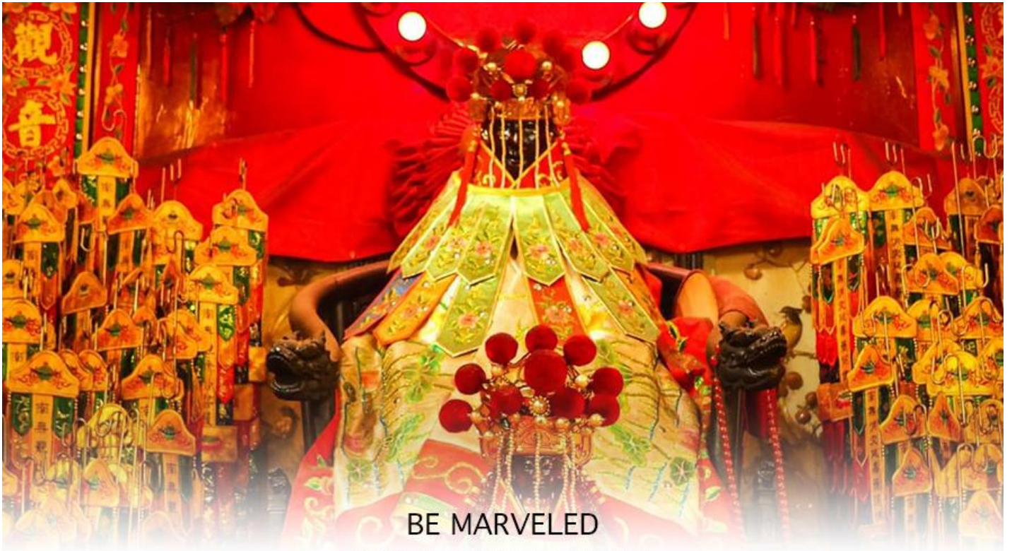
BE MARVELED วัดเจ้าแม่กวนอิมฮวงอ่า (ยิมจิน)

หลังวันตรุษจีน ไป 26 วัน จะเป็นวันเปิดทรัพย์ที่จัดขึ้นในทุกๆปี พิธีนี้จะมีเพียงครั้งปีละครั้งเท่านั้น เป็นวันสำคัญอีกวันที่คน หลัง ไหลมาไหว้ขอพรอย่างไม่ขาดสาย