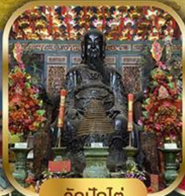
วัดปุกโต