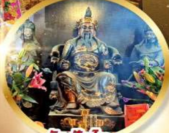
วัดบิกโต

เสริมโชคลาภนำความรุ่งเรือง ทุกด้านของชีวิต