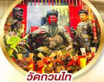
วัดกวนไท่

ขอพรเจ้ากวนอู ความซื่อสัตย์ เงินทอง รุ่งเรืองมั่นคง