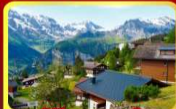
หมู่บ้านเมอร์เรน