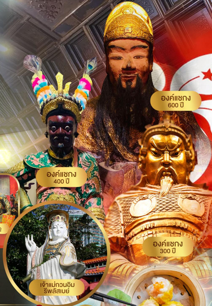
องค์เซก 600 ปี