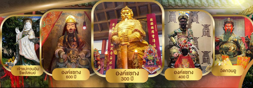
เจ้าแม่กวนอิม สวีตสเบย์