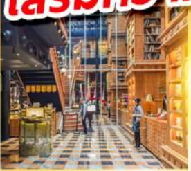
ร้านไอศกรีมมียาฮารา