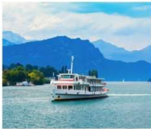
ทะเลสาบลูเซิร์น