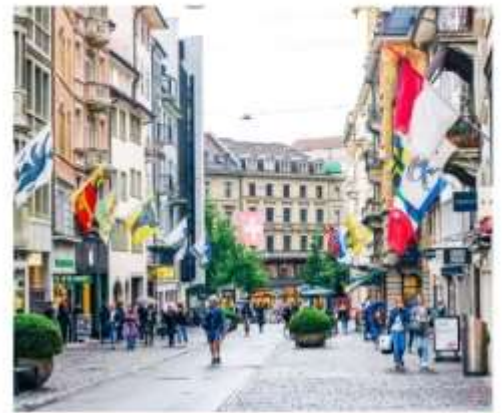
ถนนบาห์นโฮฟชตราสเซอร์