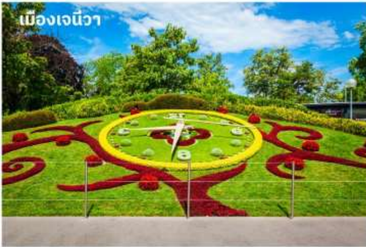
เมืองเจนีวา

จากนั้นนำท่านเดินทางไปยัง เมืองโลซานน์ ใช้เวลาเดินทางประมาณ 1 ชั่วโมง เป็นอีกเมืองที่ตั้งอยู่บนของทะเลสาบเจนีวา เมืองโลซานน์นับได้ว่าเป็นเมืองที่มีเสน่ห์โดยธรรมชาติมากที่สุดเมืองหนึ่งของสวิตเซอร์แลนด์มีประวัติศาสตร์อันยาวนานมาตั้งแต่ศตวรรษที่ 4 ในสมัยที่ชาวโรมันมาตั้งหลักแหล่งอยู่บริเวณริมฝั่งทะเลสาบที่นี่ เนื่องจากเมืองโลซานน์ตั้งอยู่บนเนินเขาริมฝั่งทะเลสาบเลคเลมังค์ จึงมีความสวยงามโดยธรรมชาติ ทิวทัศน์ที่สวยงามและอากาศที่ปราศจากมลพิษ จึงดึงดูดนักท่องเที่ยวจากทั่วโลกให้มาพักผ่อนตากอากาศที่นี่ เมืองนี้ยังเป็นเมืองที่มีความสำคัญสำหรับชาวไทยเนื่องจากเป็นเมืองที่เคยเป็นที่ประทับของสมเด็จพระเจ้า