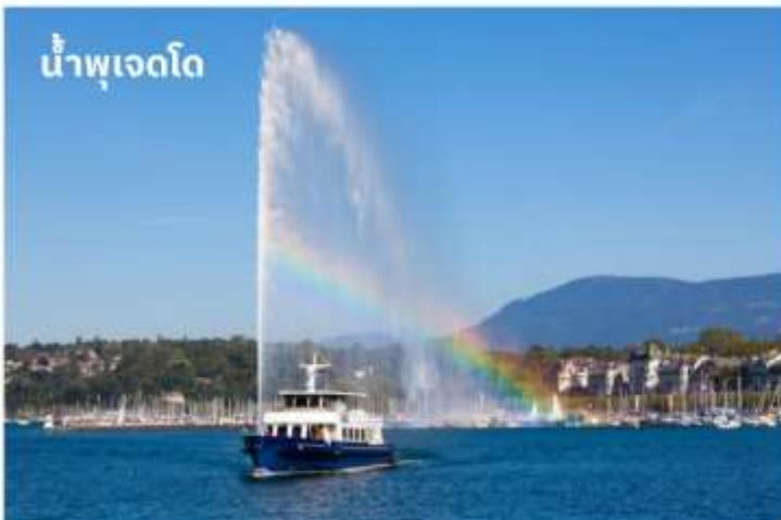
น้ำพุเจดโด

บริการอาหารค่ำ ณ ภัตตาคาร นำท่านเข้าสู่ที่พัก Novotel Bussigny หรือเทียบเท่า