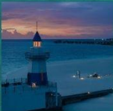
Light House Restaurant