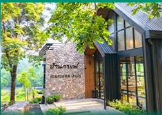
ร้านอาหาร สวนสวย 168