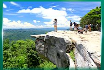
จุดชมวิวกาสุตาแผ่นดิน